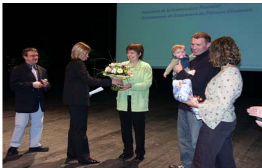
Lors de la soirée de lancement, la collectivité remet symboliquement la première Carte d'Hôte à un couple de touriste.

→ Côté prestataires, même satisfaction : plus de fréquentation, une offre valorisée. De nombreux partenaires vont donc s'inscrire dans la démarche, pour l'enrichir, dès l'année prochaine.